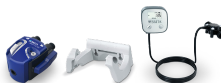
PURITY C Filterkopf Set VIII 0 - 70%