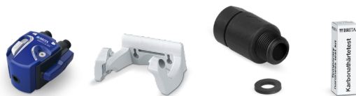
PURITY C Filterkopf Set III 0 - 70 %