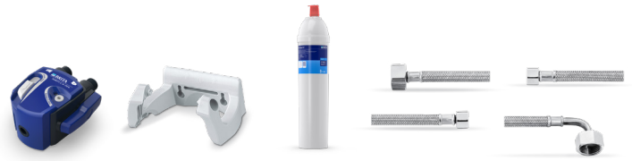
PURITY C150 Quell ST Starter Set 8