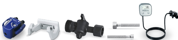
PURITY C Filterkopf Set VII 0 - 70%