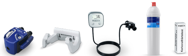
PURITY C300 Quell ST Starter Set 7