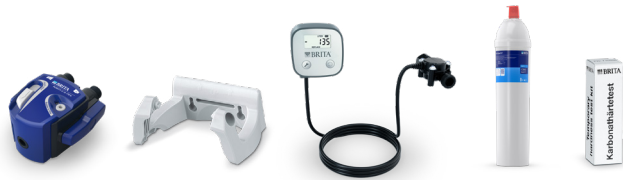
PURITY C150 Quell ST Starter Set 4