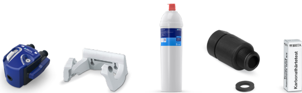
PURITY C300 Quell ST Starter Set 6