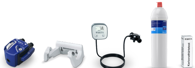
PURITY C500 Quell ST Starter Set 10