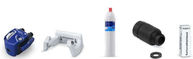
PURITY C150 Quell ST Starter Set 5