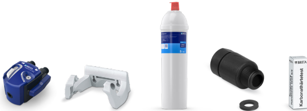
PURITY C500 Quell ST Starter Set 11