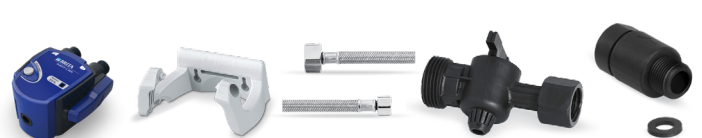
PURITY C Filterkopf Set VI 0 %