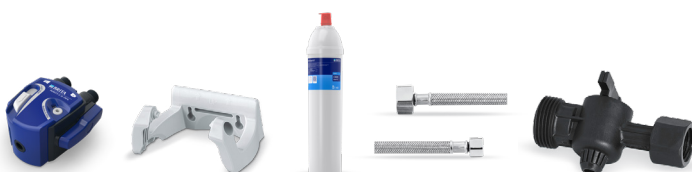
PURITY C150 Quell ST Starter Set 2