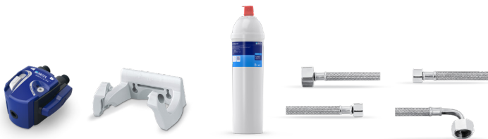
PURITY C300 Quell ST Starter Set 9